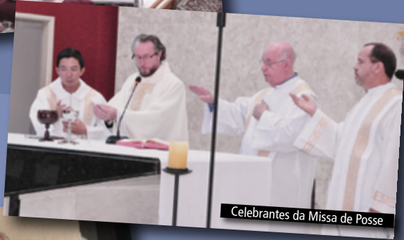
Celebrantes da Missa de Posse