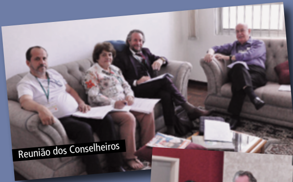
Reunião dos Conselheiros