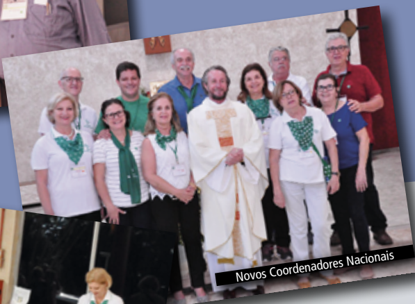
Novos Coordenadores Nacionais