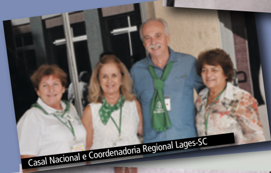
Casal Nacional e Coordenadoria Regional Lages-SC