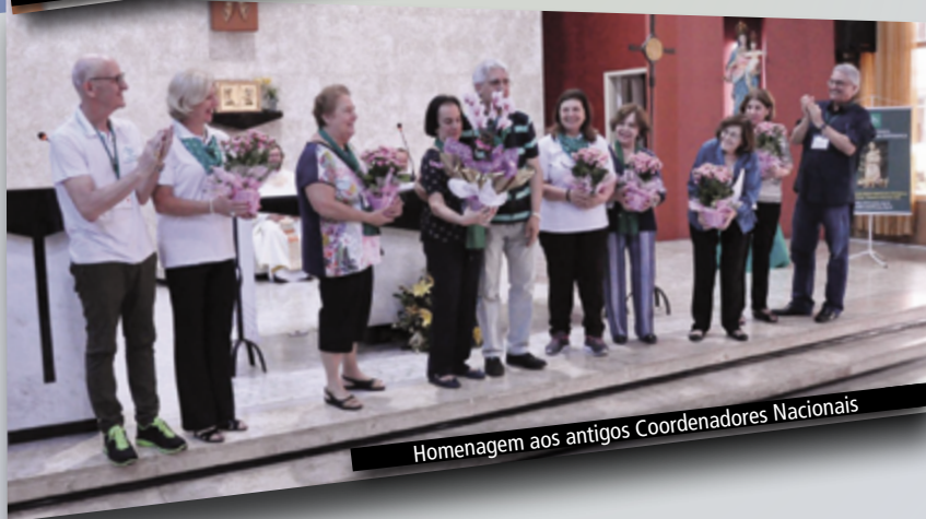
Homenagem aos antigos Coordenadores Nacionais