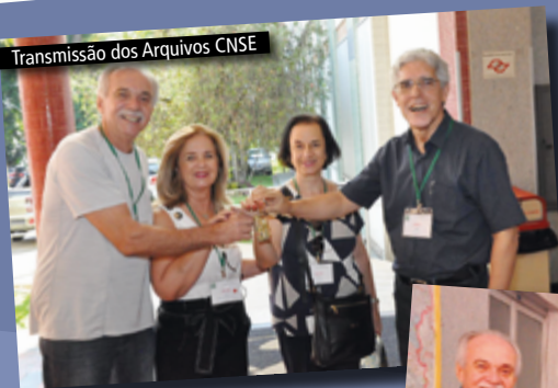
Transmissão dos Arquivos CNSE