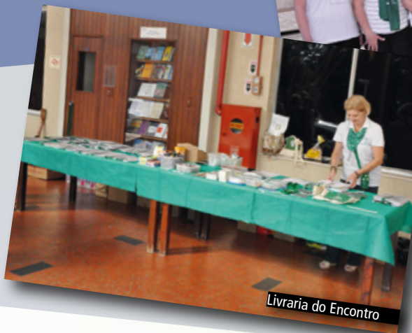
Livraria do Encontro